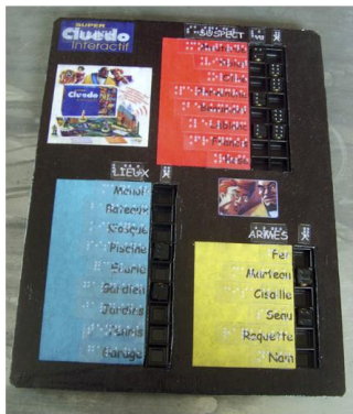
personnage Rencontré (= pochette personnage ouverte)

Version sonore et interactive du Cluedo classique, avec des aménagements minimes dans la règle du jeu.